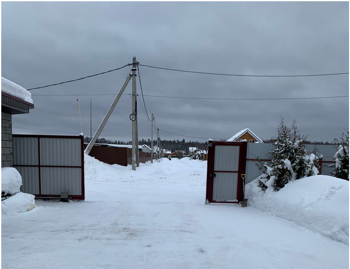
Рисунок 3 – Вид на улицу Солнечная.

Фотофиксация существующего состояния территории представлена на рисунке 3, 4, 5.