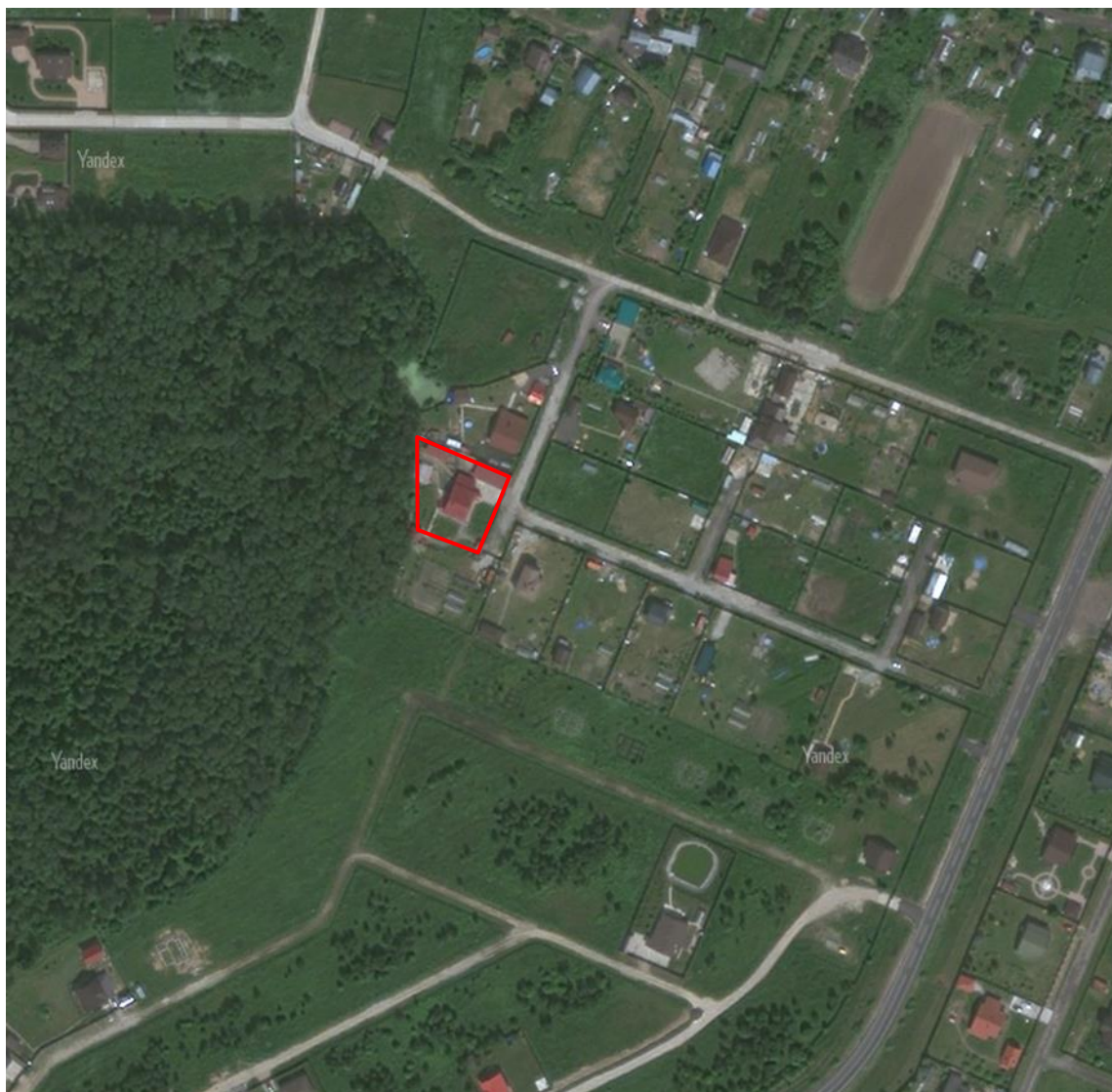
Рисунок 2 – Космоснимок рассматриваемой территории

Космоснимок рассматриваемой территории представлен на рисунке 2.