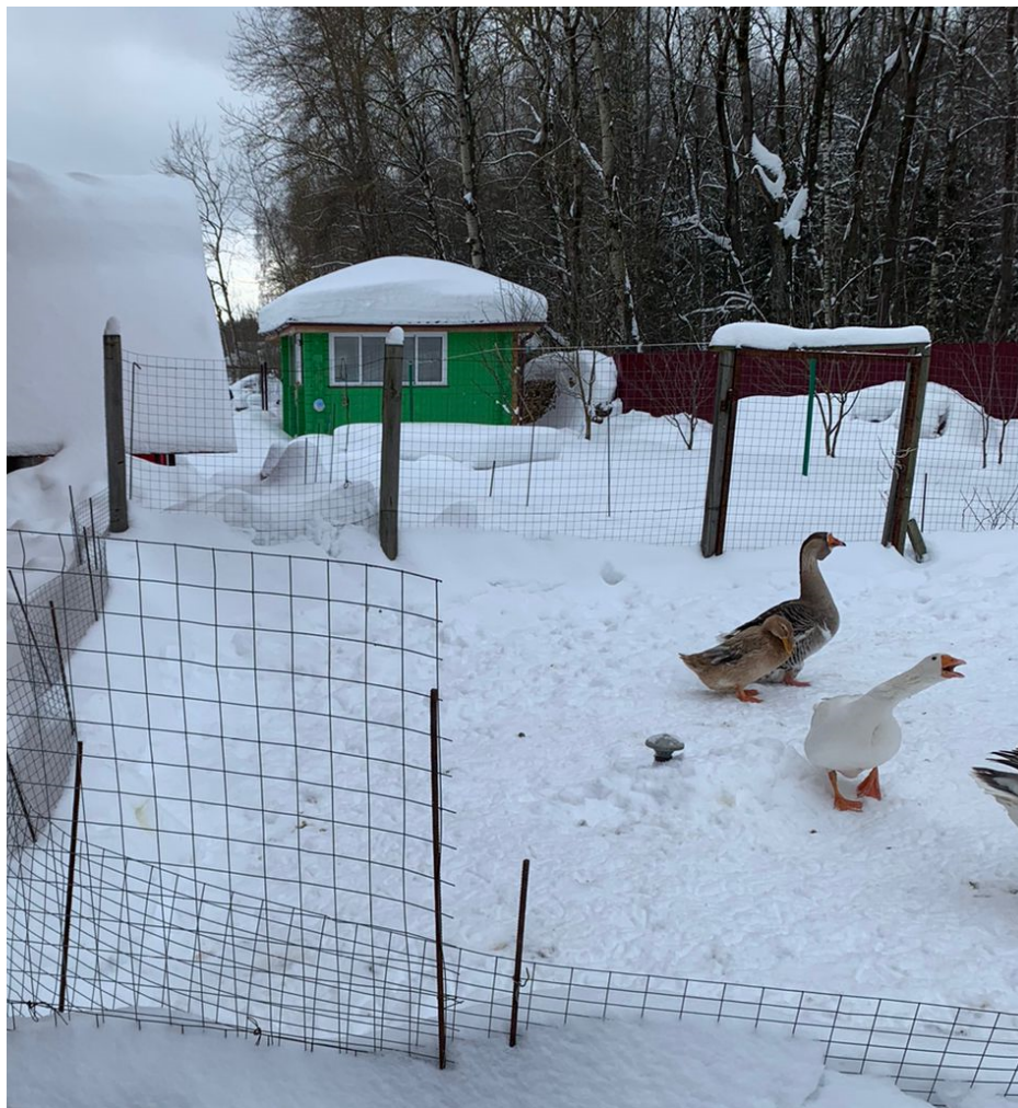
Рисунок 5 – Вид со двора .

Рассматриваемый земельный участок с кадастровым номером 50:32:0050112:1495 имеет категорию земель «Земли населенных пунктов», вид разрешенного использования (согласно выписке из ЕГРН об объекте недвижимости от 22.12.2021г.) - «для дачного строительства» , площадь - 1532 кв. м.