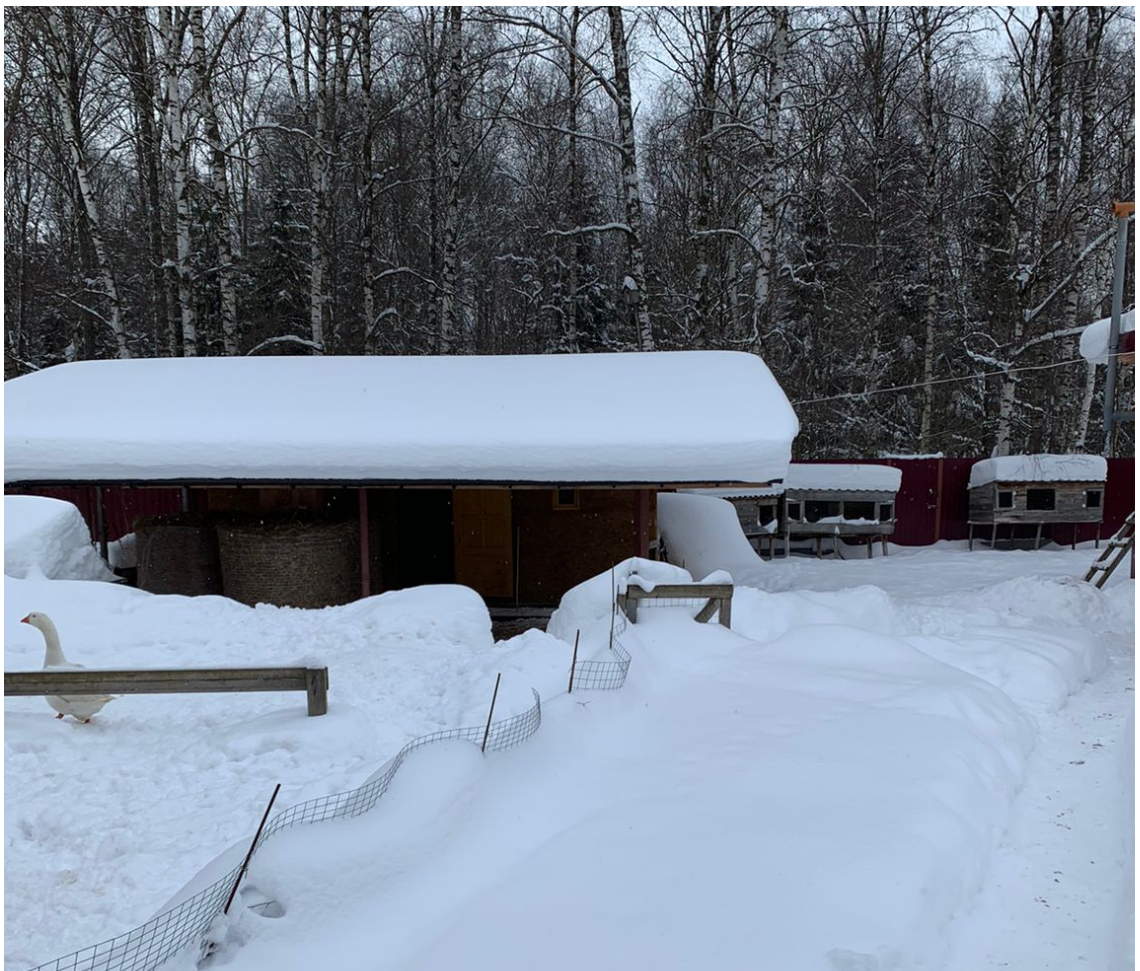
Рисунок 4 – Вид со двора .